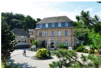
Seehotel Maria Laach

Auf dem Freigelände und im Laden finden Sie ein umfangreiches Pflanzenangebot, gute Beratung und vieles mehr, was das Gärtnerherz höher schlagen lässt.