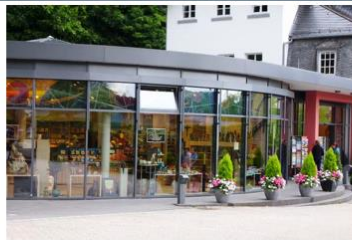
Buch- und Kunsthandlung

Die Keramikmanufaktur produziert handgedrehtes und gegossenes, von Hand bemaltes Steinzeug, schöne Gebrauchs- und Alltagskeramik sowie Plastiken und Objekte.